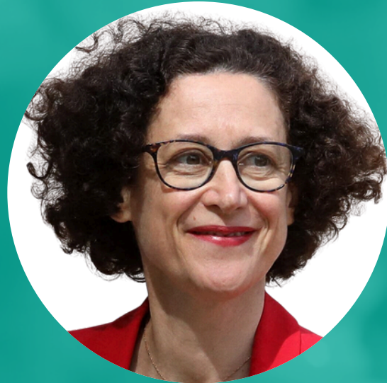
Emmanuelle Wargon Ancienne ministre et Présidente de la CRE